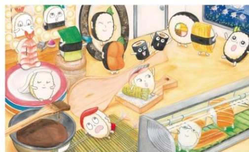
やまざき ゆ き 「おすしアイドル」