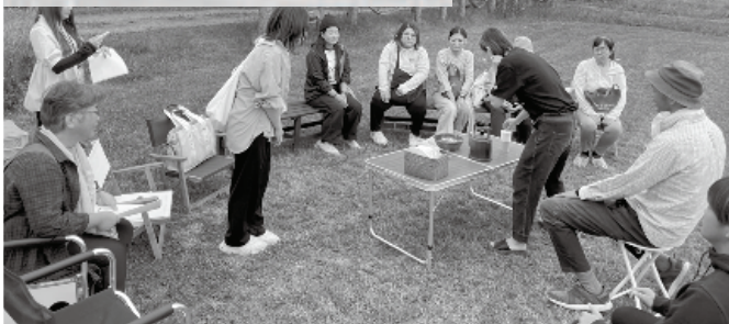
視察研修を行う女性農業者団体「きらめく翼」

農 家の皆さんの発 想を活かした新 たな取組が町の活性化 につながり、食に携わ る方から直接学べる恵 まれた食育環境にも期 待しています。