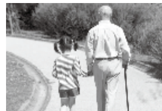
子どもたちの異変に「気付き」ことが重要となる

①アンケート調査は現在のところ実施する予定はありませんが、実態把握については、相談を受けるケースに対して個別ケース会議を実施するなど、関係機関との連携を図り対応していきます。 ②北海道が作成したリーフレットを配布するとともに学級活動の時間等を活用して説明し、ヤングケアラーについての理解や気付きを促進して早期発見と支援につなげる取り組みを行っています。 ③北海道教育庁が設置している「おなやみポスト」や関係機関の相談窓口を周知し、児童生徒が自ら相談できる環境を整えています。 家庭以外で、児童生徒の様子を日常的に把握できるのは主に学校です。ので、担任を中心とした教職員が児童生徒の普段とは異なる様子を察する「気付き」が重要です。 異変を察知したときは学校から教育委員会へ、さらに町へ情報提供を行い、関係機関とも連携しヤングケアラーの支援に取り組んでいきます。