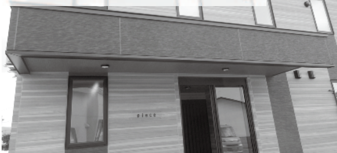
町で整備した学生寮「piece（ピース）」

遠 軽高校は地域に必要な学校です。授業料の無償化による影響へのさらなる対策が必要です。