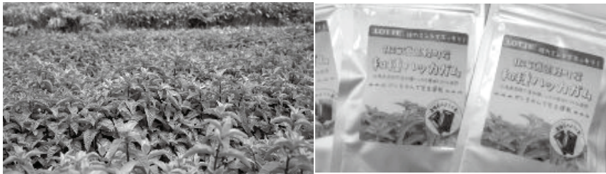
下) 町内で栽培しているハッカとその加工品