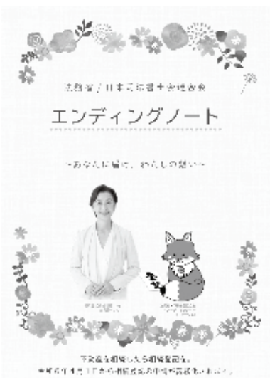
法務省のホームページで公開するエンディングノート

見本等を設置しており、法務省でもインターネット上で公開し無料で入手できますので、町で作成し配付するより、その存在や活用を啓発することが肝要と考えています。