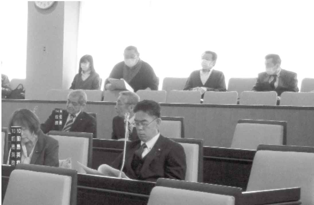
一般質問を傍聴する丸瀬布社会福祉協会の職員たち