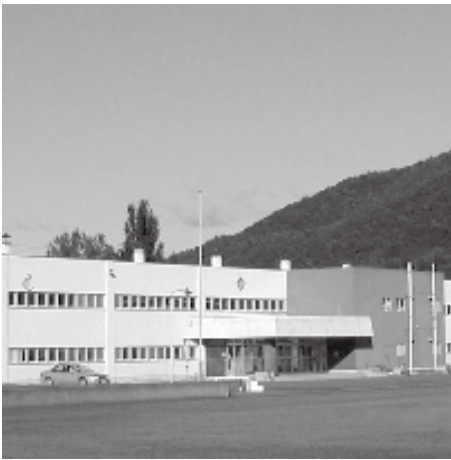
令和8年度末をもって閉校が決まった白滝中学校

令和9年度の統合に向けて、具体的な内容については事前に生徒や保護者などに対して、十分な情報提供が必要であると