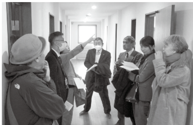
寮を見学する総務・文教常任委員たち

また、学生たちの入寮に先立ち、3月17日に総務・文教常任委員たちが寮を見学しました。