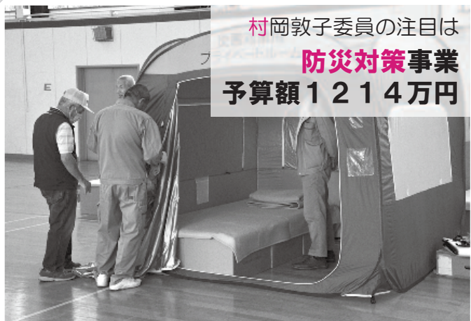
町で備蓄するプライベートルームなど