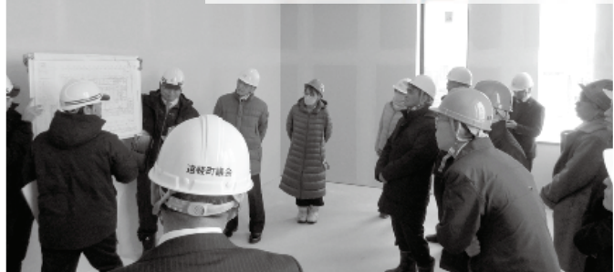
建設中の新庁舎を見学する議員たち