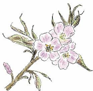
遠軽町の木 エリヤマザクラ

令和6年度は、森林環境譲与税や利子により8600万円を積み立て、7024万円を取り崩しました。