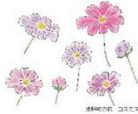
新井町の町花 コスモス

令和8年度予算額193億4800万円のうち、産業・観光の分野には、13億7708万円を計上しています。