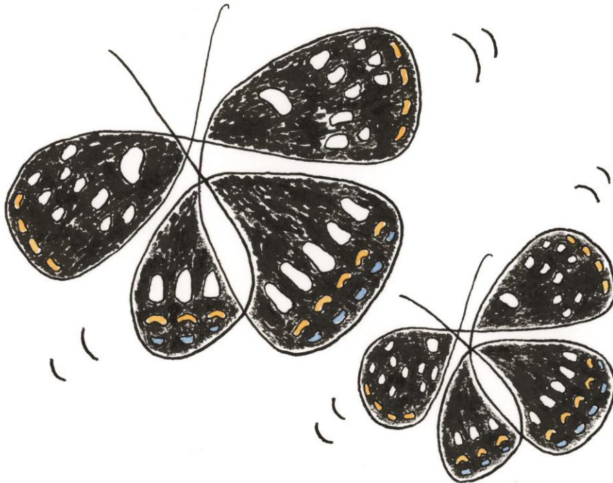
遠軽町の蝶 オオイチモンジ