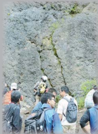
ジオツアーの様子

白滝地域の赤石山周辺は、黒曜石の巨大露頭をはじめ、さまざまな火山活動の爪痕が残されています。