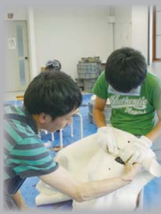
黒曜石を使った石器づくり

遠軽町埋蔵文化財センターでは、黒曜石を使った石器づくりのほか、まが玉やガラス玉づくりなどオリジナルのアクセサリづくりを体験できます。