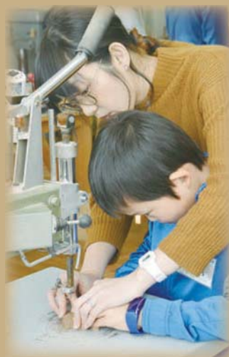
木工体験の様子 (ちゃちゃワールド)

専門の指導員のもと、半製品のキットの組み立てや、自分だけのオリジナル作品の製作を体験できます。