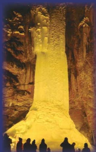
ライトアップされている 「山彦の滝」

丸瀬布地域にある、高さ28mから流れ落ちる「山彦の滝」。裏側に回っても見られることから別名「裏見の滝」とも呼ばれます。