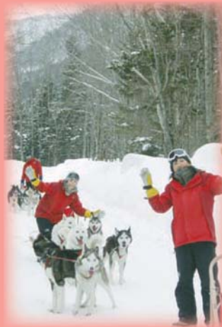
犬ぞり体験の様子

体験者自らが犬ぞりを操作しながら冬の大自然の中をトレッキングするもので、ちょっとした冒険家になった気分が味わえます。