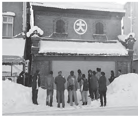
▲前回審査時の様子

審査結果につきましては、町広報紙や白滝ジオパーク公式ホームページでお知らせします。