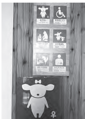
▶美幌町の道にあるトイレの表記

例えば、美幌の道にある写真のトイレ表記です。北海道らしくさらにかわいい雰囲気です。ささいなことですが、こういった遊び心も大切に重要視できる仕事に携われたらとても幸せだなと思います。