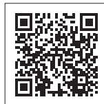
申込フォームQRコード

■申込方法 窓口・電話・FAX・ウェブ・電子メールのいずれかでお申込みください。 なお、FAX・電子メールでお申込みの方は①氏名②生年月日③住所④電話番号⑤受診希望項目⑥希望日と受付時間の6点を必ず記入してください。 また、ウェブ申込みは、下記QRコードからお進みください。 申込みは、検診日の前日までですが、定員に達しているときは受診できないことがあります。 ■その他 ・新型コロナウイルス感染拡大防止のため、「待合室の密集を避ける」「検診会場での滞在時間を短くする(受付時間を分ける、問診票の事前記入)等配慮して実施します。 ・今後の状況により、検診が中止になる場合もありますのでご了承ください。 申込問 保健福祉課(げんき21) ☎42・4813 FAX49・3120 丸瀬布支所 ☎47・2211 FAX47・2128 電子メール e-hoken@engaru.jp ホームページ https://engaru.jp