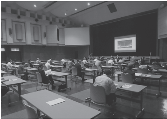
▲住民説明会の様子

【今後の予定】 マテリアルリサイクルセンターは令和6年度、最終処分場は令和7年度の供用開始に向けて、基本計画の策定や、生活環境影響調査等の事業を進めていきますので、引き続き、住民皆様のご理解とご協力をよろしくお願いします。