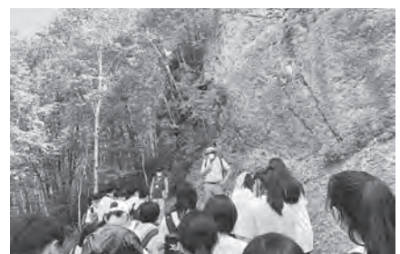
▲八号沢露頭の大きさに驚く生徒の皆さん

講演中、生徒たちは専門家の話に耳を傾けて、うなずきながら熱心にメモを取る姿が見られました。