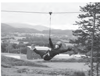
▲ツリートレッキングラスト全長85mのジップライン！クセになる気持ち良さですよ〜！

遠軽に来て約5か月が経ち、社名淵のみどり牧場で牛さんにミルクをあげたり、湧別町シブノツナイ湖でカヌーに挑戦したり、サロマ湖で夕日を見たりと地域の魅力を楽しんで過ごしていますが、この遠軽・オホーツクエリアは見どころが多く、行きたい場所が絶えません！こんな時代だからこそ、遠軽の魅力を発掘し、町民の皆様にも魅力を再発見、再認識してもらえるよう取り組んでまいります。★