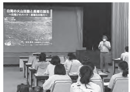
▲始めて聞く黒曜石のお話がありました