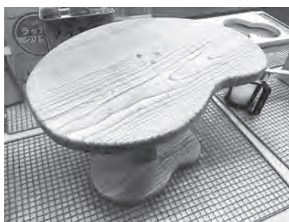
▲全くの素人の私でも木楽館の指導員さんのアドバイスでサイドテーブルを作成することができました。

地域おこし協力隊として、小さなことからではありますが、木楽館に通い木工体験を続けていこうと思います。