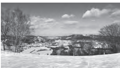
▶実際に見るととても開放感がありました。

町の資源をより理解するためにも、みなさんの知識・技術を教えていただきたいです。そして、これから遠軽町の資源をより一層活用して料理や栄養、食育といった視点から情報発信に取り組んでいきたいと思っています。