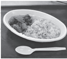
鹿肉たつぷりエソシカレ

ジオパークに来て食べてみたいメニューや、出してほしいものがありましたら、教えてください。そして、白滝ジオパーク交流センターへのご来館、白滝マンモス食堂へのご来店を心よりお待ちしております。