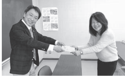
温泉ソムリエの資格を認定されました。

そして、遠軽町の温泉の魅力を詳しく伝えたいと思い、泉質や入浴法について学ぶ講習を受け、温泉ソムリエの資格を認定されました。遠軽町の温泉はアルカリ度が高く、とろりとした手触りで、肌をツルツルにしてくれる美肌の湯です。皮膚の汚れや油分を落とすしてくれるので、湯上がり後は、保湿剤などで潤いを与えるのがお勧めです。これからもどんどん温泉に入っ、もっときれいな温泉になりたいと思います。