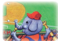
ガボンドのバット