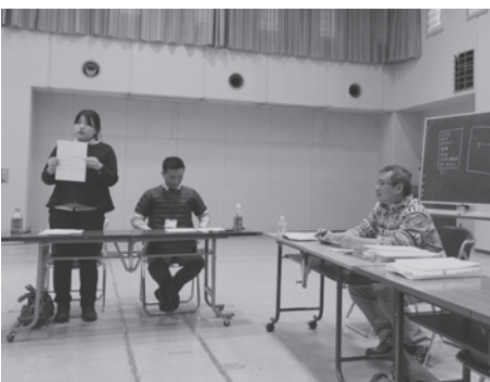
▲網走市で行われたオホーツク地域おこし協力隊連絡会発足ミーティング

そして、道の駅のPRや運営に生かし、遠軽町の魅力の発信に役立てていきたいと思っています。