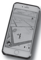
▲スマートフォン用ゲーム「ポケモンGO」

おそらくスマートフォン用ゲーム「ポケモンGO」を楽しまれているものと思われます。「ポケモンGO」は、人工衛星などの電波による位置情報を利用して地図上の場所に行くことで、ゲームを進めるようになっています。ご近所の公園はゲーム上の道具などを獲得できる場所となっていました。町としましては、一般的なルールを守ってゲームを楽しむことは規制できませんが、念のため警察署に状況をお伝えし、パトロールを強化していただくこととしました。