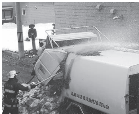
▲火災が起きたごみ収集車両