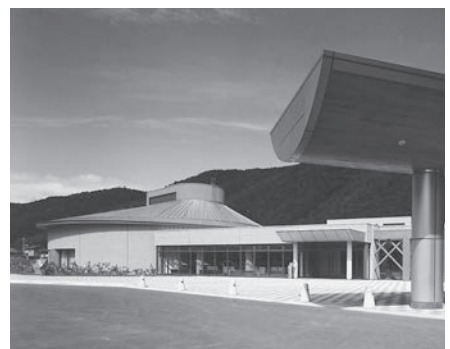
▲会場の白滝国際交流センター