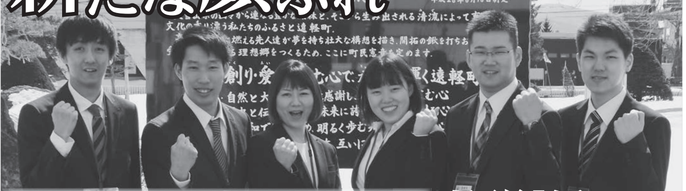
◆◆遠軽町新規採用職員（4月1日）◆◆